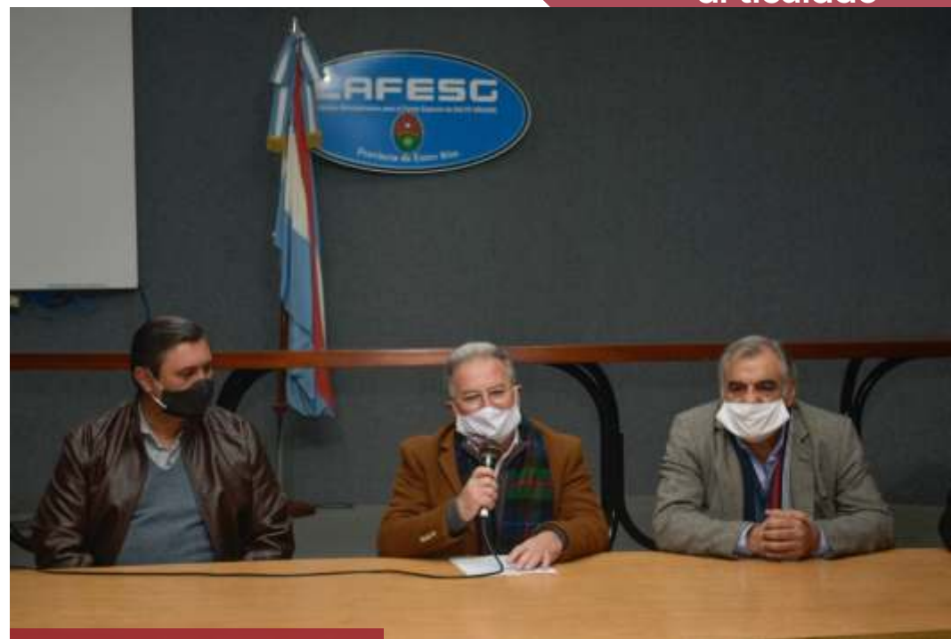
Internet para escuelas de Concordia.

El Consejo General de Educación y el Ministerio de Educación de Santa Fe organizan el encuentro de ajedrez educativo Dos Provincias, a disputarse el miércoles 29 de julio de 18 a 19.30 horas en la plataforma global Lichess. La modalidad de juego será por tiempo, con partidas de 20 minutos (10 para cada ajedrecista) y está destinado a estudiantes de primaria.