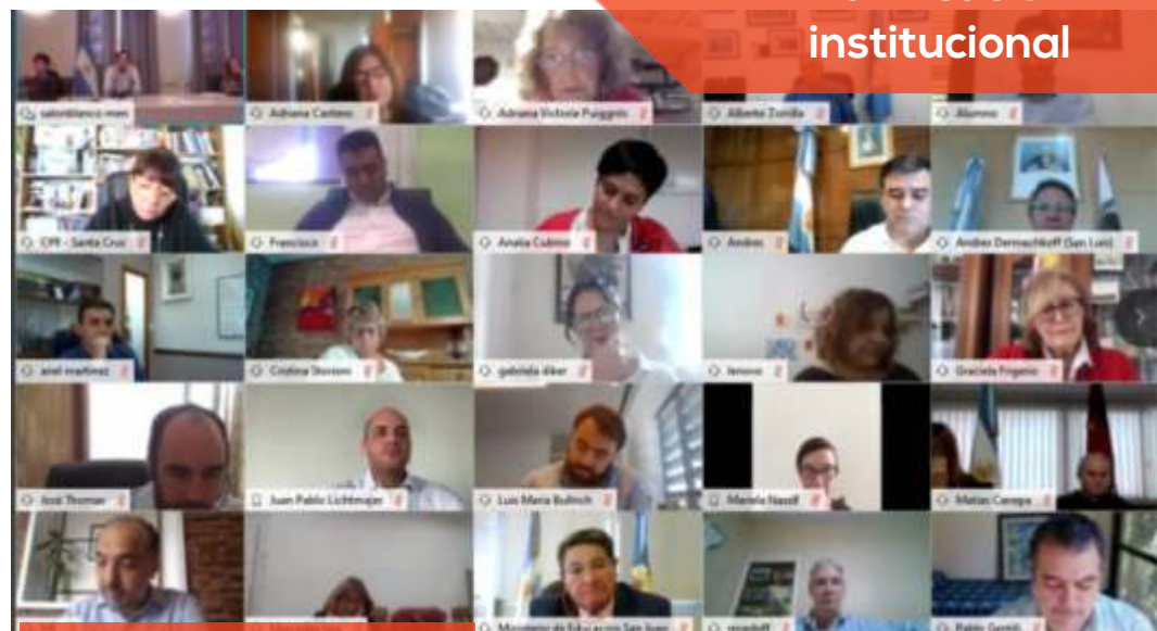
Videoconferencia del Consejo Federal de Educación.

El BID favorecerá a través de sus recursos técnicos y financieros, la generación de equipos de monitoreo y capacitación que asesore a los organismos educativos. De la videoconferencia participaron representantes del Proyecto Educar 2050, el Banco Interamericano de Desarrollo y los ministros de Educación de Tucumán, Córdoba, Mendoza, Salta, Jujuy, Misiones y Entre Ríos.