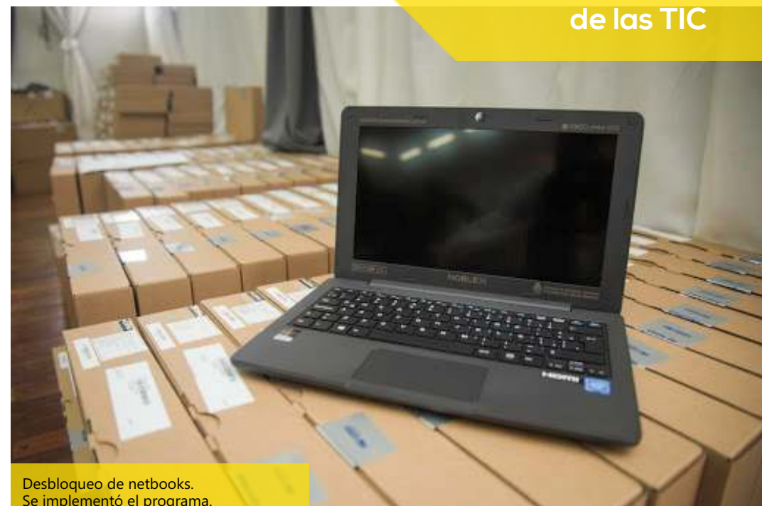
Desbloqueo de netbooks. Se implementó el programa.

El presidente del CGE acompañado de los vocales y el secretario general del organismo, mantuvo tres reuniones virtuales con los directores departamentales de escuelas para relevar la situación de esta segunda etapa de propuestas educativas no presenciales y seguir de cerca la evolución en territorio del programa Contenidos en Casa, conjuntamente a los cuadernos Seguimos Educando del Ministerio de Educación de la Nación.