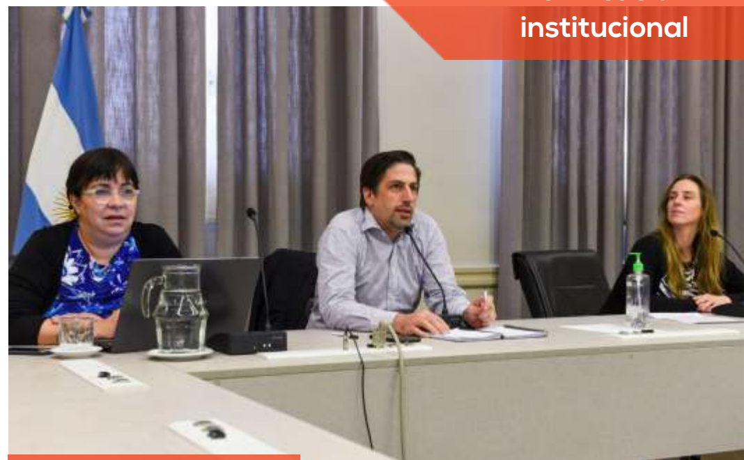
Reunión virtual: acreditación del primer trimestre.

Durante el diálogo virtual, los ministros mencionaron la importancia de continuar impulsando el programa Seguimos Educando que tiene como objetivo colaborar