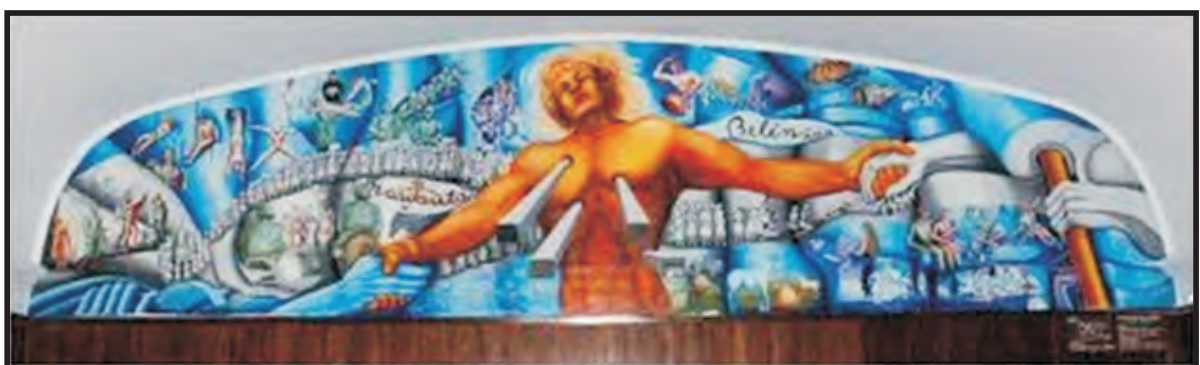
Mural Argentina, Dolor y Esperanza, de la artista plástica Amanda Mayor.