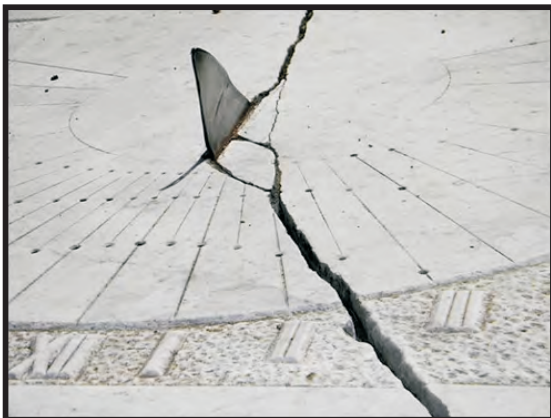
Reloj de Sol de la Plaza Urquiza Concordia