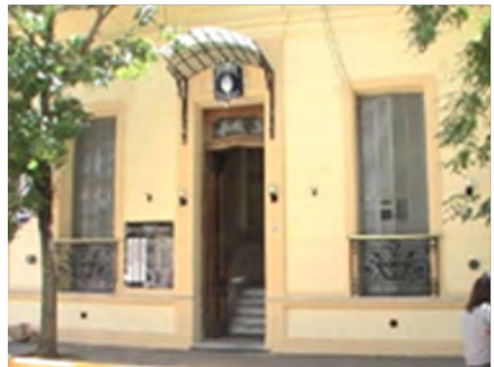
En la Delegación de la Policía Federal de Concepción del Uruguay, fue colocada una placa que señala al edificio como Centro Clandestino de Detención y Tortura durante la dictadura militar que gobernó el país desde 1976 a 1983.

En noviembre de 2011 se señaló el espacio donde funcionó un Centro Clandestino de Detención y Tortura (CCDyT), lugar en el que estuvieron secuestrados y sufrieron torturas, entre otros, 18 estudiantes secundarios de Concepción del Uruguay en julio de 1976 12 . La señalización que identifica al lugar como CCDyT estuvo cargado de un fuerte simbolismo, ya que la elección recayó en una joven presidenta del Centro de Estudiantes de la Escuela Normal Mariano Moreno y el Comisario Mayor de la Policía Federal Argentina, delegación Concepción del Uruguay. Hace 37 años, otros actores se encontraban en ese lugar, unos como víctimas y otros como victimarios, por lo cual no representa un dato menor que ambos descubrieran juntos el contenido de la placa.