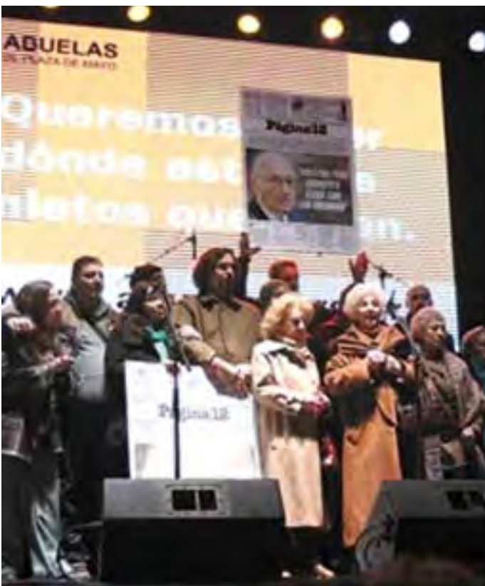
Miembros de organizaciones sociales y de derechos humanos escucharon las condenas frente a los tribunales

En todos sus años de lucha, las Abuelas encontraron a varios de esos nietos desaparecidos y pudieron generar conocimiento sobre el proceso de restitución del origen familiar.